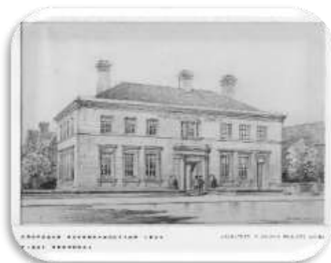
Deacon's Bank (Banc Brenhinol yr Alban), Ffordd Conwy