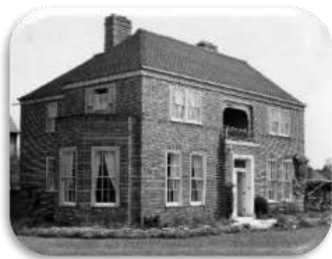
Wren's Nest Lansdowne Rd