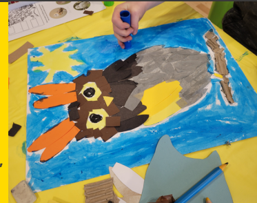
Gwaith Creu Conwy

Mae Creu Conwy Ifanc wedi parhau i ddarparu gweithgareddau cynhwysol rhad neu am ddim dan arweiniad artist ar gyfer teuluoedd, plant a phobl ifanc, diolch i gyllid gan Gyngor Celfyddydau Cymru a Chronfa Plant a Chymunedau Llywodraeth Cymru.