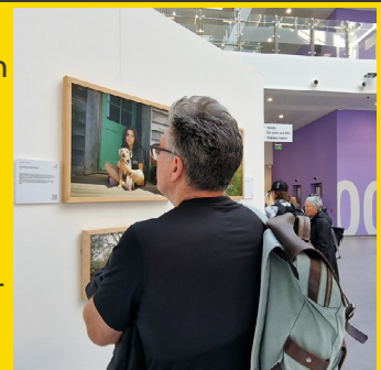
Arddangosfa Northern Eye

Roedd yr ŵyl yn canolbwyntio ar Benwythnos Siaradwr Craidd yn Theatr Colwyn a 13 arddangosfa am ddim ar draws y dref.